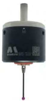
Sonda Tastatore / Touch Probe