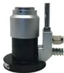
Tastatore / Tool Length Setter