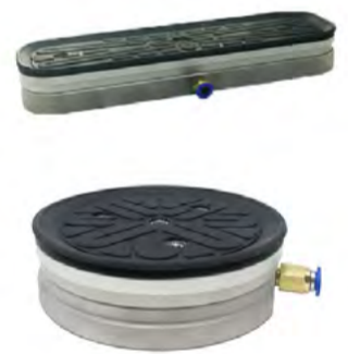
Ventose / Suction Cups